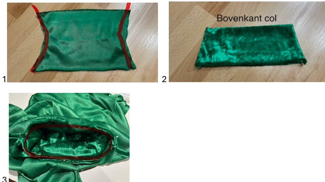
FOTO 1: Neem nu de twee col delen en leg de goede kanten op elkaar. Speld en stik de schuine kanten, bij kindermaten zijn de zijkanten recht en kan je ervoor kiezen om 1 kant open te laten. Hier kan je dan klittenband aanzetten.

FOTO 3: Speld en stik nu de mouw-, en zijnaad dicht.