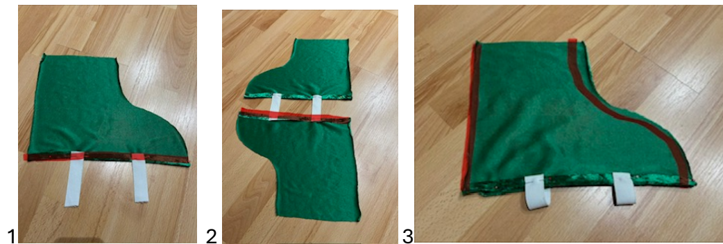
FOTO 1: leg een zoompje in de onderkant van 1 deel van een overschoen, speld hierbij ook de 2 elastieken mee, 1 ter hoogte van de bal van de voet (voorste) en de ander aan de voorkant van de hak.

FOTO 2: Neem vervolgens het andere schoendeel en leg ook hierin een zoompje en stik hierbij het andere einde van het elastiek vast.